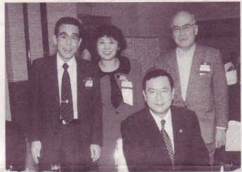
歓談される枚方市長