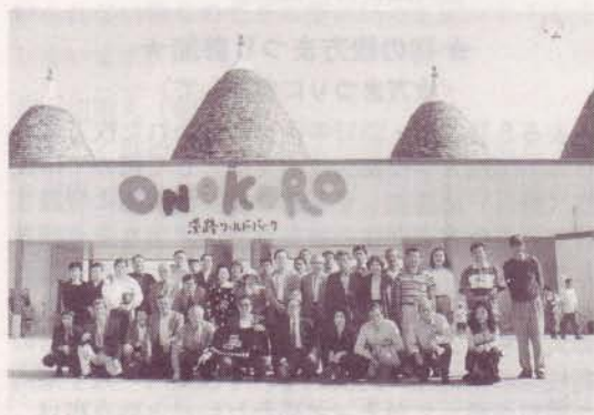
淡路ワールドパーク ONOKOROゲート前にて