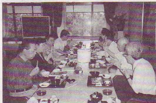
宇陀カントリーにて朝食

翌7日はゴルフ組のキャンセルが出た為、ゴルフを中止、全員一緒に1万坪の敷地の室生村の滝谷しょうぶ園を見学、昼食後は天理大学付属参考館にて貴重な歴史の資料をみせて頂いた後、一路枚方へ帰校いたしました。