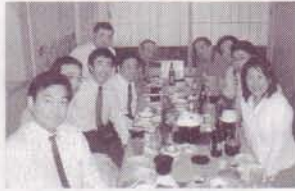
元気で明るい食事会の様子

5月19日(金)午後7時00分より、橘花屋(たちばなや)にて第1回青年部食事を開催いたしました。10名の若い校友にご参加いただき、元気で楽しい酒の席となりました。