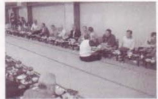
なごやかな雰囲気の中での昼食会