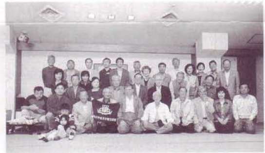
長良川温泉「十八楼」にて