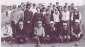
参加者全員による集合写真