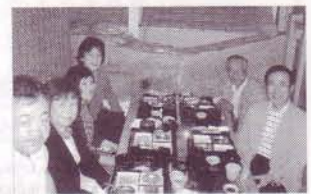
和気あいあいとした茶話会の様子

5月28日（日）正午より、栗屋（しおりや）ジャポネにて第1回女子部茶話会を開催いたしました。7名の校友にご参加いただき、和気あいあいとした楽しいひとときを過ごすことができました。