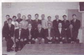
参加者全員による集合写真