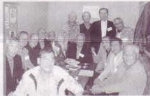
ひと部屋に集まって参加者全員でハイ、チーズ!

平成18年5月13日(土)、枚方市駅前のジャンボカラオケ広場にて15名の校友のご参加のなか開催いたしました。今回はご参加の皆さんに一曲でも多くの歌を歌っていただくため3部屋を借り切ったため、皆さんにはご満足いただくことができました。