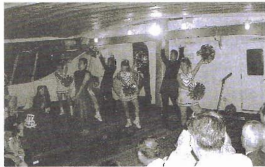
応援団リーダー&チアガール