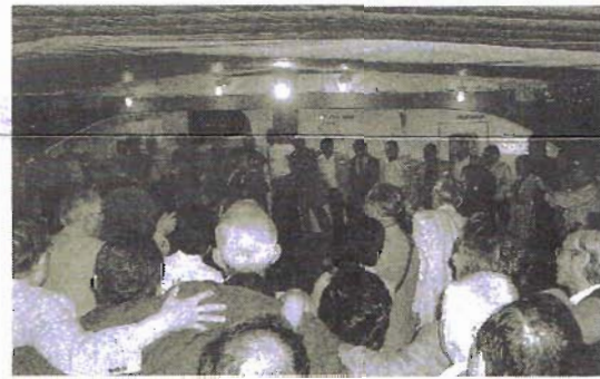
参加者全員で肩を組んで道選歌