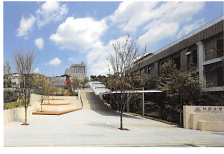
▲阪急関大前駅北 新アクセス