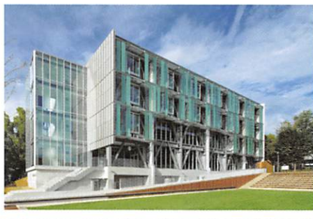
▲イノベーション創生センター