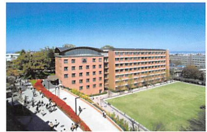
▲千里山キャンパス