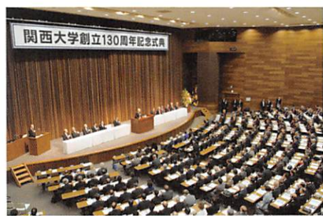
▲創立130周年記念式典