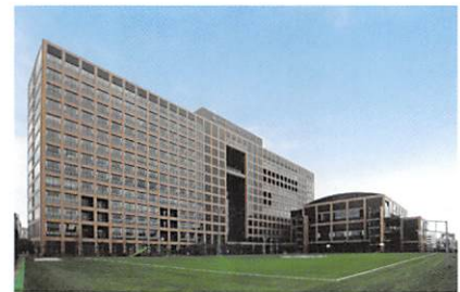
▲高槻ミュージーズキャンパス