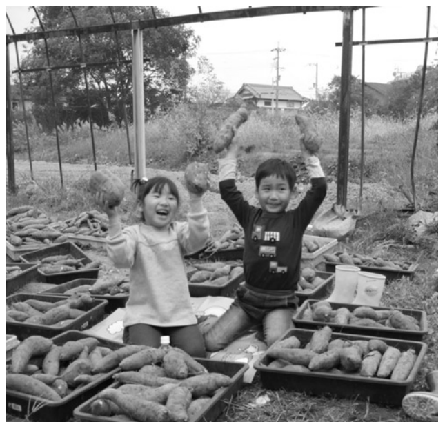
土に親しむ子ども達

る3本の畝を、2、3人です先に根元から刈り取り、その後をみんなで次々と赤紫のサツマイモを掘り出した。大きいものからこぶりのものまで、それこそ『芋ずる式』につながって出てくる。老いも若きも童心にかえってワイワイ歓声を上げながら夢中で掘ったかいあって、見る間に周り一面サツマイモで埋まった。