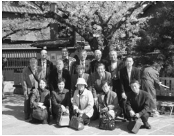
巽橋のたもとにて

白川の清流に架かる巽橋そばの桜は、カレンダーにも載る人気の撮影スポットで一同記念撮影。巽橋は切