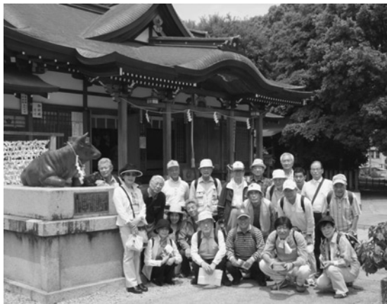
菅原道真ゆかりの萩原天神

萩原天神の創建年代は不詳、社記によれば天徳3年(960年)菅原道真公を日置高庭の境内末社に祀るとあり、境内から出土する古墳時代の無数の須恵器破片および時代は下がるが古