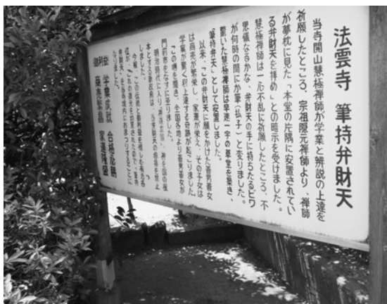
法雲寺 筆持弁財天

表題に掲げた「梵鐘のふるさとを訪ねて」はまさに、今日散策したところであり、平安末期から河内の国を本