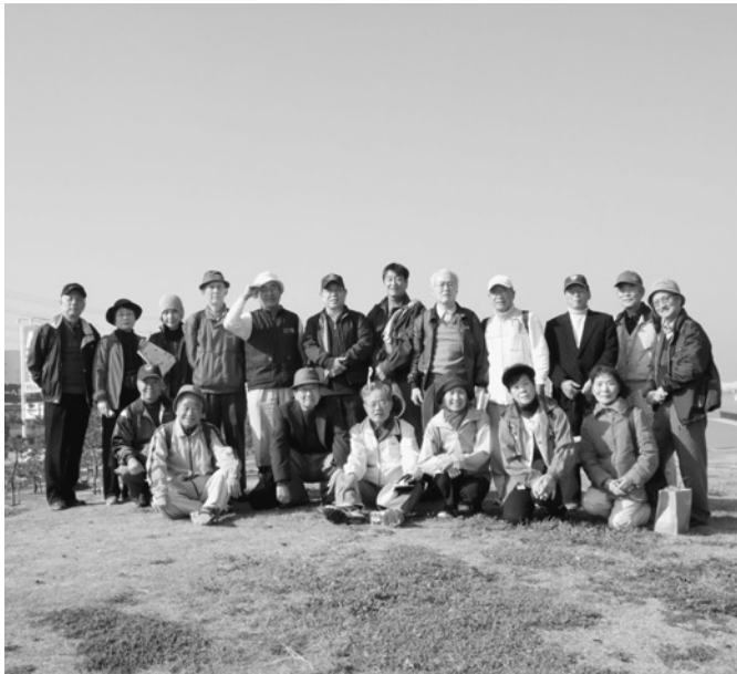
シーサイドステージ(21世紀型コンビナートにて)