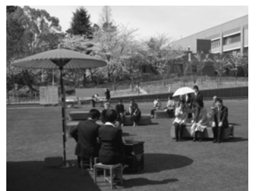
現役学生によるお点前(悠久の庭)

料展示室で「関大ルネッサンスー岩崎卯一没後50年記念展」を見学する。私自身が在学していた頃に、学長として教授としての教壇でのお姿を思い浮かべながら見学する。