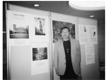
梅田地下街写真展示(2008.12)