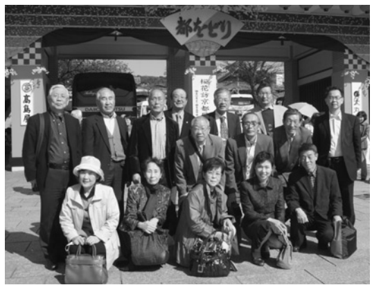
祇園甲部歌舞練場

り通しが白川南通と新橋通にぶつかる手前の小さな橋。まわりにはお茶屋や町屋が並び、花街情緒を漂わせている。満開の桜と柳の並木が続く石畳の白川通り沿いは平日にもかかわらず人が多い。風情満点の巽橋から、一同は、お茶屋が並ぶ花見小路を南に歩き、祇園甲部歌舞練場へ向かった。