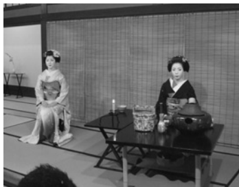
芸妓さんのお点前

「ヨイヤサア」の掛け声と共に第138回都をどりが開演。都をどりは全八景の構成で、春から夏・秋・冬そしてまた春へと四