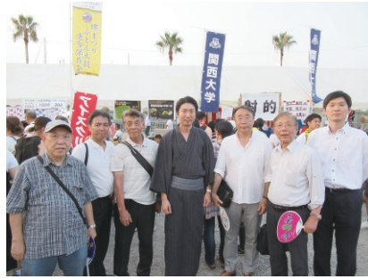
永藤英機堺市長と (写真中央着物姿)

堺大魚夜市は堺市堺区にある大浜公園で毎年7月31日に行われる魚市、住吉大社神事。鎌倉時代に始まったと言われ、およそ700年の歴史を誇る堺の夏の風物詩的行事で、多数の来場者があり地域住民と密着した歴史的なお祭りです。堺支部では関西大学校友会の地域連携事業として、今年