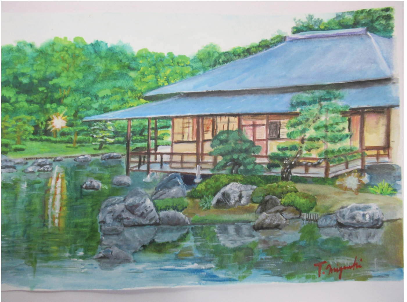
大仙公園 日本庭園

URL http://www2.kandai-koyukai.com/al/sakai/ E-mail : ku-sakai@mbn.nifty.com