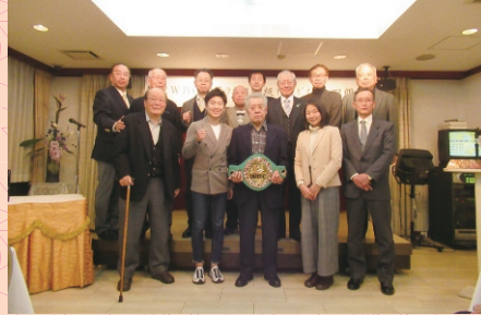
新入会員のみなさん