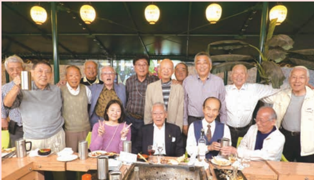
5.10.19 関親会 南海グリル