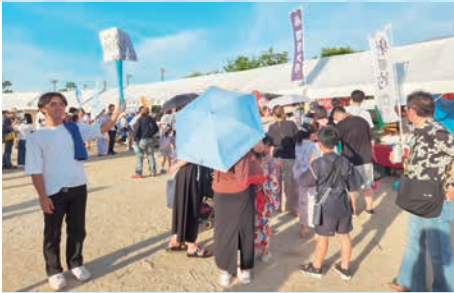
「最後尾」の案内を掲げる安田ゼミ生