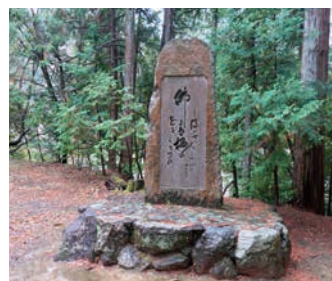
「仏には・・・」の歌碑

西行法師は晩年の文治5年、当寺の座主空寂上人の報徳を慕って、ここに住み文治6年(1190)2月16日。73才で当寺で入寂されている。西行は1118年佐藤義清で生まれ、18才で兵衛尉に任官。20才で鳥羽院北面の武士として安樂寿院御幸に供奉す。23才で出家。東山・嵯峨・小倉山に草庵を結び、27才伊勢や奥羽の旅、32才で高野山に草庵を結び、51才中国・四国の旅に出る。善通寺で草庵を結ぶ。55才平清盛の千僧供養に参加。63才高野を出て伊勢二見浦に草庵を結ぶ。69才再度奥羽の旅に出る。70才嵯峨に草庵を結ぶ。72才弘川寺に草庵を結び病臥す。生前には数多くの詠を読まれている。境内には隅谷元支部長のルーツを知る意味で、隅屋桜が咲いていた。河内監名所記等に「すや桜」「規桜」という名称がみられ、南朝の