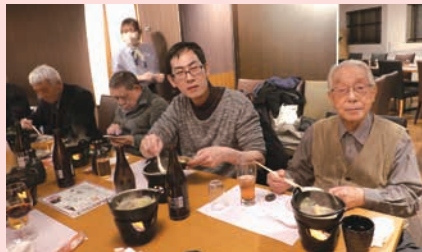
6.3.22 関親会 にんにん