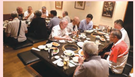
6.7.26 関親会 昌久園