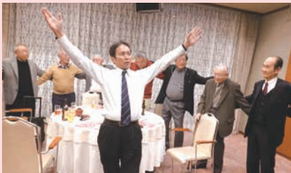
5.12.8 忘年会 南海グリル