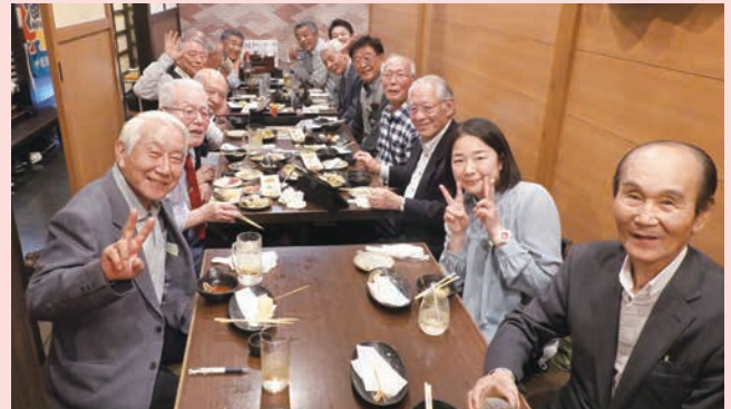
6.5.16 関親会 「源平水軍」堺東店